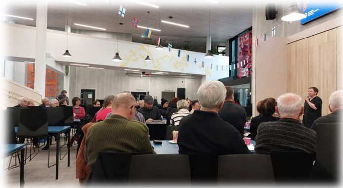
Suomussalmen järjestöilta 2024

Strategiamme arvot Vastuullisuus, Avoimuus, Luotettavuus ja Oikeudenmukaisuus (VALO) näkyvät myös osallisuusohjelmassa.