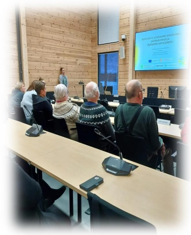
Järjestöilta Paltamossa 2024