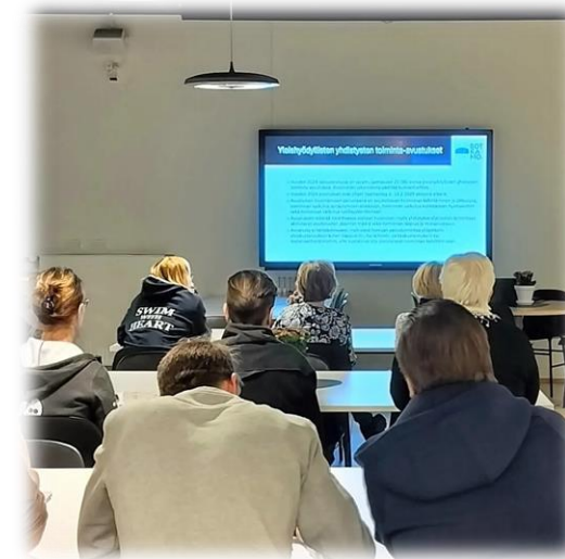
Sotkamon järjestöilta 2024